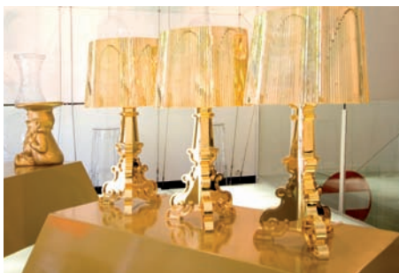
Show-Room Kartell - Paris

...comme à l'Atelier ou au salon de coiffure GD à Tourcoing