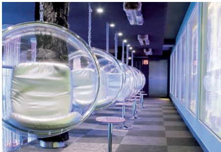
Bubble Chair, IceKube Paris